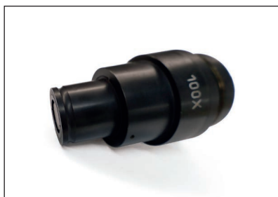
› Objetiva com ampliação de 100x cód.400.400-04