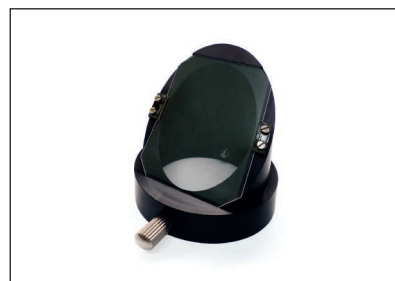
› Espelho semi-refletor (acompanha cada objetiva)