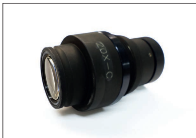
› Objetiva com ampliação de 20x cód.400.400-02