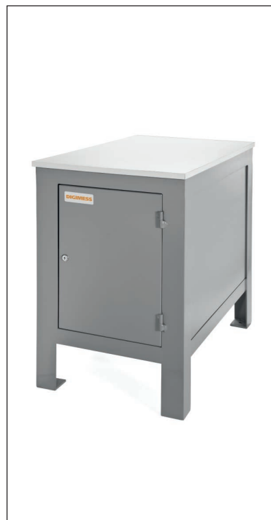
› Bancada (tipo armário) para o projetor, fabricada com cantoneiras de aço pintado cód.400.400-25