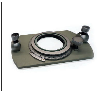
› Mesa giratória com graduação de 1° cód.400.400-14