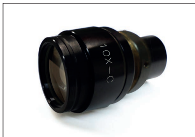
› Objetiva com ampliação de 10x cód.400.400-01