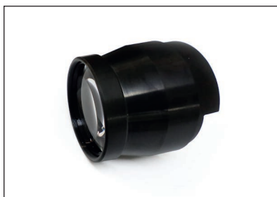
› Lupa manual com ampliação de 5x cód.400.400-15