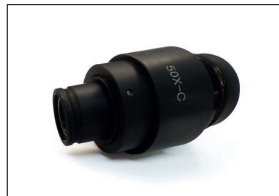
› Objetiva com ampliação de 50x cód.400.400-03